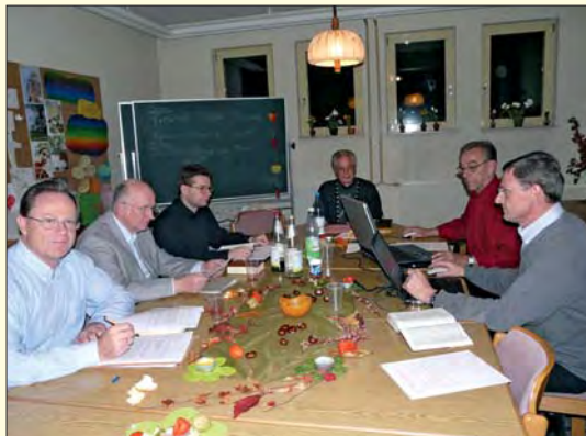
Die Mitarbeiter arbeiten in drei Gruppen die 13 Manuskripte (sie entsprechen den wöchentlichen Themen) durch.

Pastor in Halle, seit 1995 Mitarbeiter im Arbeitskreis Bibelschule.