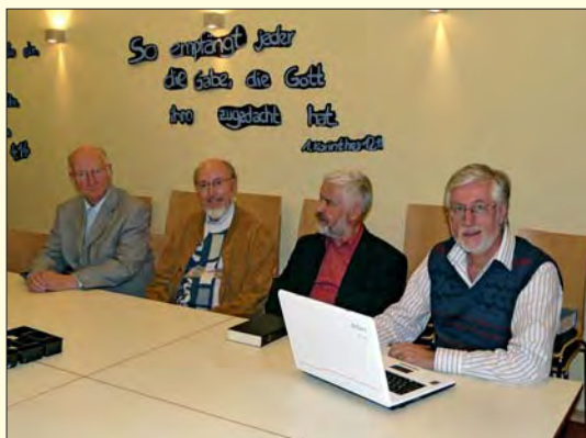
Jede Arbeitsgruppe des Arbeitskreises Bibelschule wird von einem Gutachter geleitet.

halb ist das persönliche Studium die Grundlage für ein ertragreiches Gespräch.